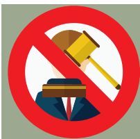
sedang dicabut hak pilihnya berdasarkan putusan pengadilan yang mempunyai kekuatan hukum tetap