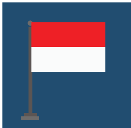
Warga Negara Indonesia