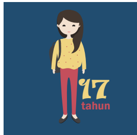
17 Tahun pada saat Pemilihan