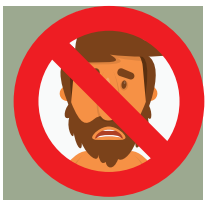
Orang yang sedang terganggu jiwa/ingatan