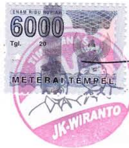
Wiranto Calon Wakil Presiden